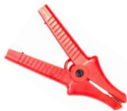
Cocodrilo rojo 11 kV 32 A