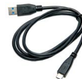
Cavo USB tipo C