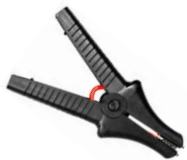
Cocodrilo negro 11 kV 32 A