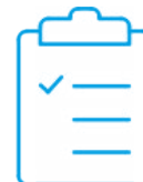
Certificado de cali- bración de fábrica