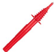
Sonda roja de punta 5 kV (toma tipo banana)