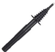
Sonda negra de punta 5 kV (toma tipo banana)