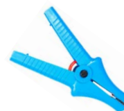
Cocodrilo azul 11 kV 32 A